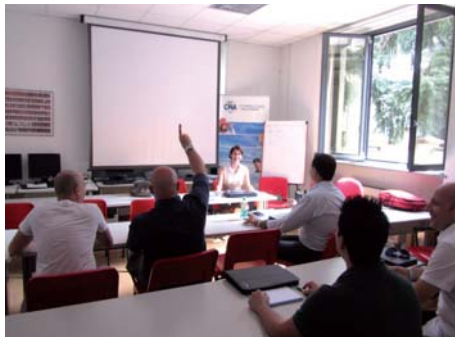
Formazione in aula di Ecipa Lombardia

Questo tipo di attività si rivolge a tutti i settori: autotrasporto, impiantistica, ambiente, manifatturiero, autoriparazione, servizi alla persona, produzioni alimentari, ristorazione e così via. Opera su tutto il territorio regionale grazie all'azione congiunta delle otto sedi