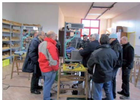
Formazione per gli impiantisti

Di attualità anche il tema della contabilizzazione del calore negli edifici. Ecipa propone una giornata introduttiva indirizzata agli amministratori di condominio e un corso tecnico per impiantisti, in partnership con Calormatica, società esperta nel risparmio energetico.